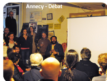
Anancy - Débat

« Le groupe local est un outil indispensable pour diffuser l'idée du Revenu de Base Inconditionnel, il permet aux personnes d'une même ville de se retrouver régulièrement pour parler de l'idée et d'organiser des événements pour la faire connaître. Ainsi, l'idée d'un RBI se propage grâce à ces petites fourmis qui travaillent localement. »