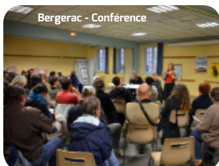
Bergerac - Conférence

Plus d'informations sur www.linconditionnel.info