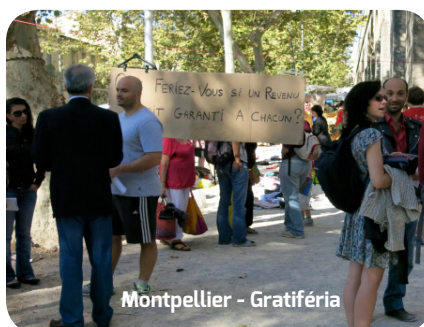
Montpellier - Gratiféria