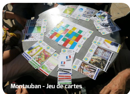
Montauban - Jeu de cartes