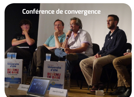
Conférence de convergence