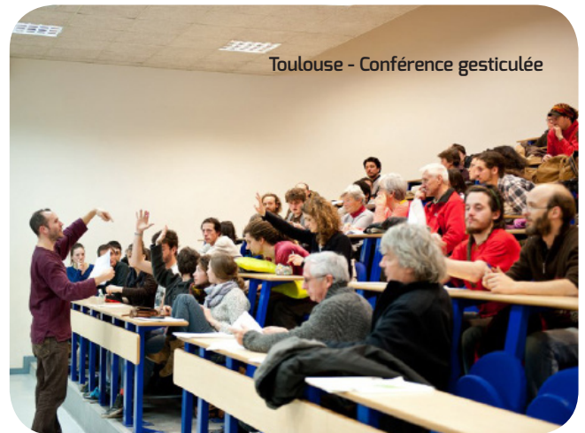
Toulouse - Conférence gesticulée

En effet, la mise en place du Revenu de Base pourrait simplement s'effectuer en transférant les budgets sociaux actuels, diminuant au passage drastiquement la complexité des aides accordées, améliorant ainsi la lisibilité du système tout en diminuant la bureaucratie nécessaire pour le faire fonctionner. Cela soulagerait par ailleurs les bénéficiaires des aides de l'humiliante épreuve du guichet social.